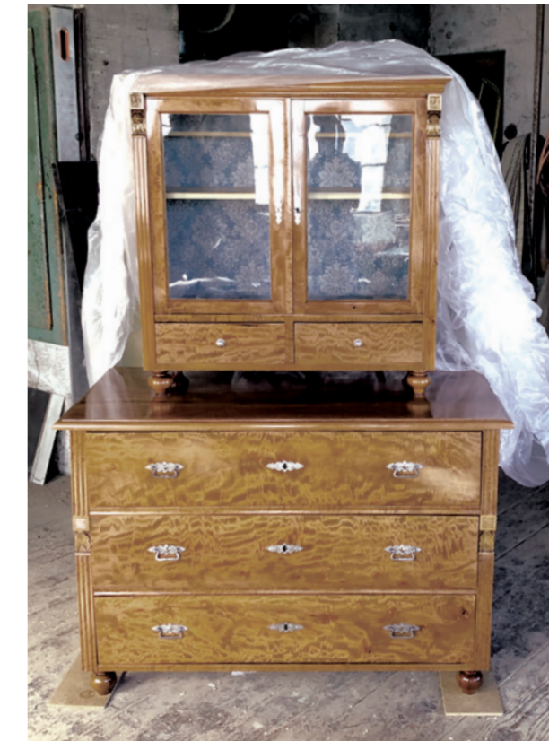
Das hatte echt keinen Lack mehr. Jetzt hat es wieder Lack. Schellack.